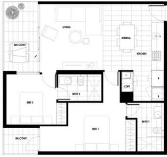
Sơ đồ mặt bằng