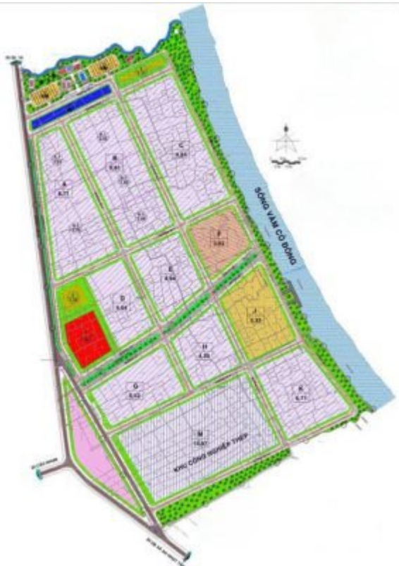
Sơ đồ dự án khu công nghiệp An Nhật Tân