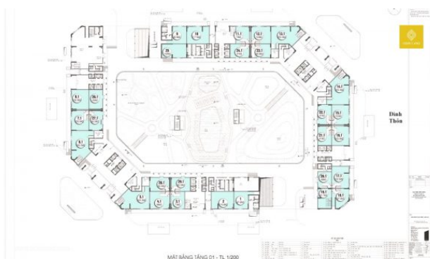
Mặt bằng tầng 1