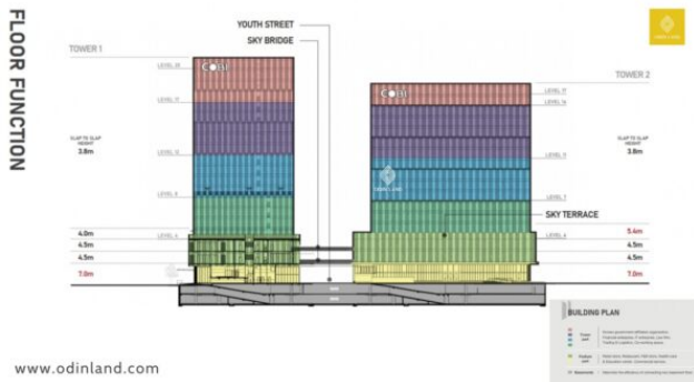
Kế hoạch xây dựng tòa nhà Cobi Tower I & II