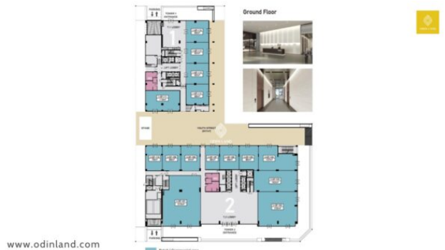
Khu mua sắm và Sky Bridges