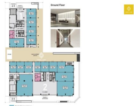
Sảnh đón và Youth Street