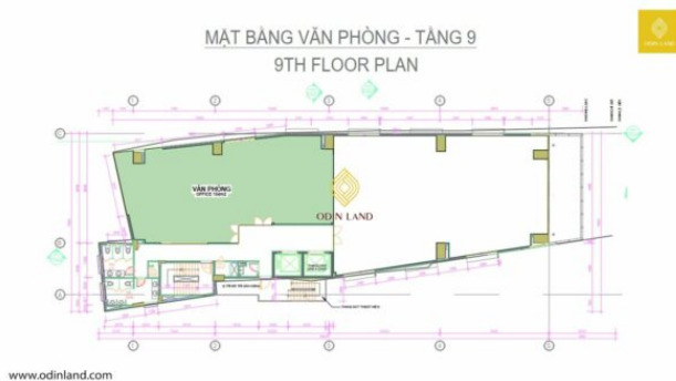
Sơ đồ mặt bằng