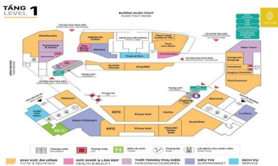
Sơ đồ mặt bằng tầng 1