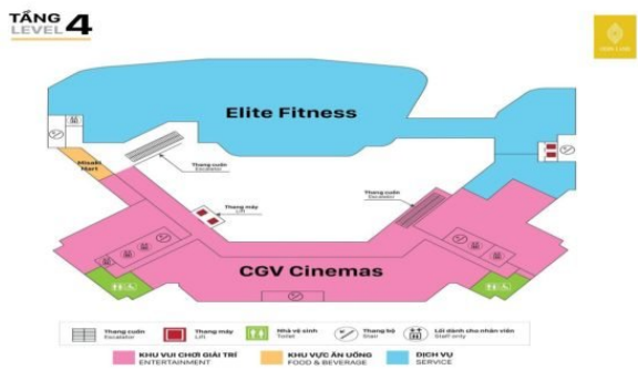
Sơ đồ mặt bằng tầng 4