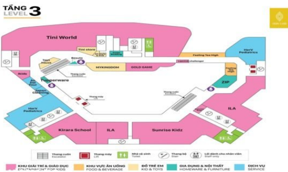
Sơ đồ mặt bằng tầng 3