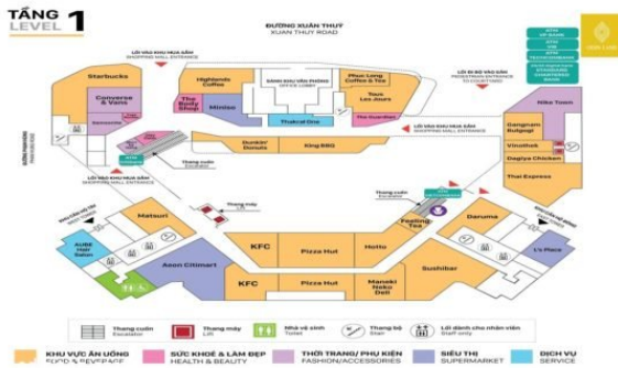
Sơ đồ mặt bằng tầng 1