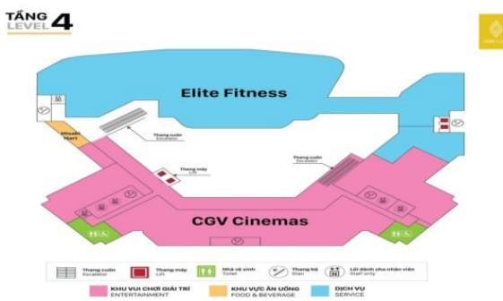
Sơ đồ mặt bằng tầng 4