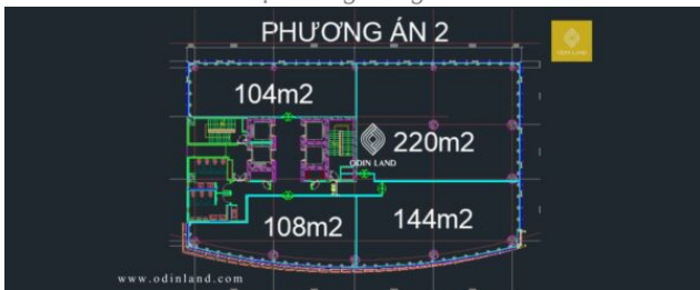
Sơ đồ mặt bằng phương án 2