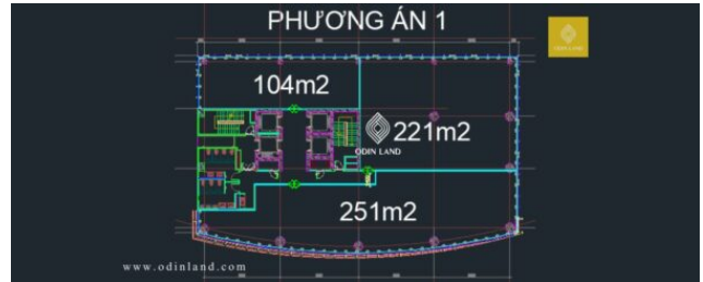
Sơ đồ mặt bằng phương án 1