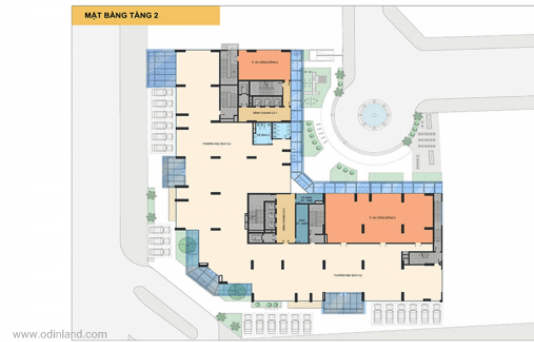
Mặt bằng tầng 2.